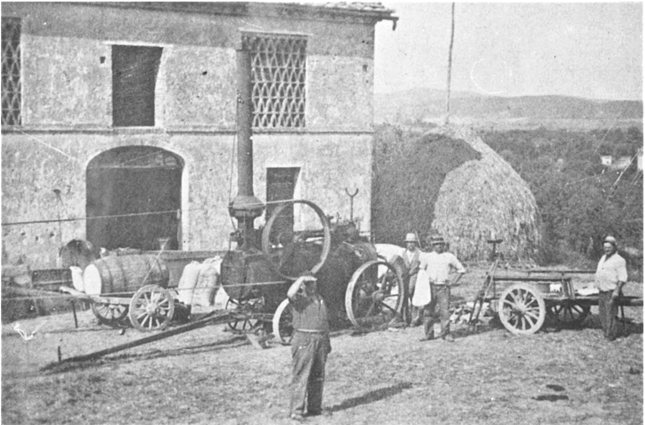
946 - Tribbiatura nell'aia del Poggiolo