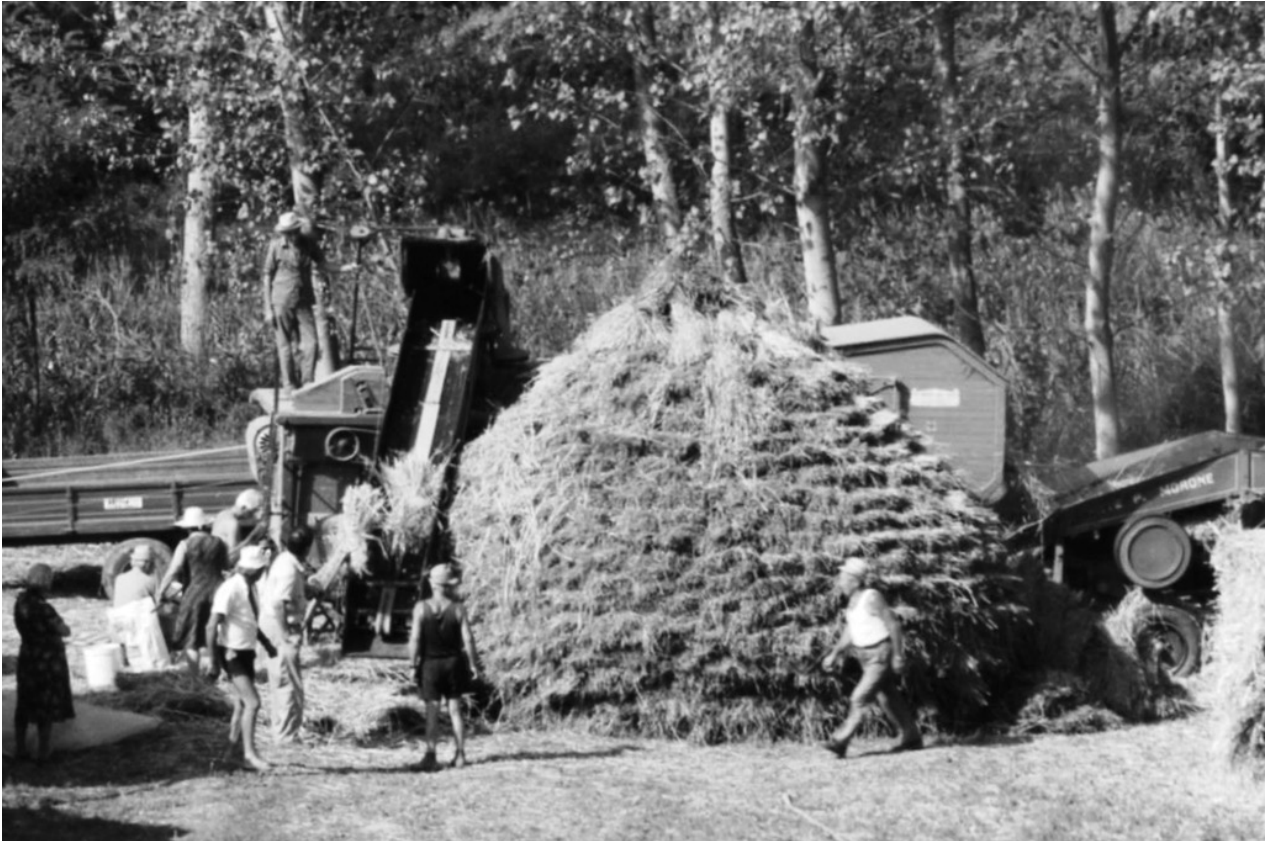
Anni '60 - Si inizia a trebbiare nei terreni lungo la Copra

lavoro meno faticoso, ma la polvere a momenti riduceva la visibilità, impediva di respirare, faceva bruciare gli occhi e si appiccicava tutta addosso e sulla faccia, rendendo le persone irriconoscibili quando uscivano a prendere aria.