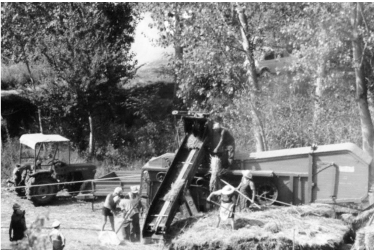
I Boccini tribbiano il loro grano in prossimità del fiume Copra

Al termine della giornata, le donne avevano preparato, vicino al pozzo o alle botti dell'acqua, due o tre bacinelle e tre o quattro asciugamani, questo era il bagno disponibile allora. I primi che si sciacquavano trovavano l'asciugamano bianco e pulito, gli ultimi invece "una carta geografica" con colori sfumati e non era possibile trovare dove asciugarsi la faccia. Quando si trebbiava nei poderi vicini al fiume, i più giovani correvano a fare due o tre tuffi per togliersi la polvere di dosso e rinfrescarsi.